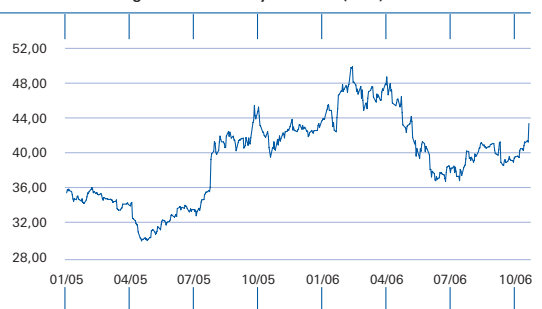
Kursentwicklung der DaimlerChrysler-Aktie (EUR)