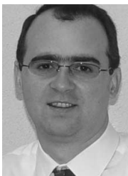
Christian Ritter Redaktion

Private Finanzen +++ Geldanlage +++ Börse +++ Steuern +++ Recht