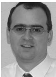
Christian Ritter Redaktion

Private Finanzen +++ Geldanlage +++ Börse +++ Steuern +++ Recht