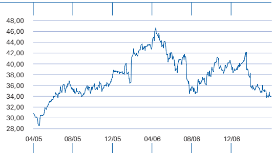
Kursverlauf der SAP-Aktie (EUR)